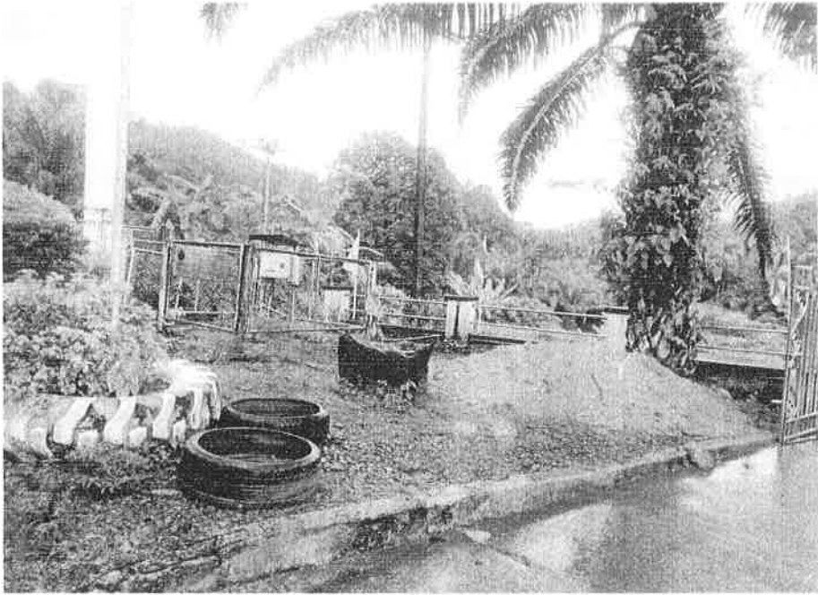
ภาพเตรียมพื้นที่ปลูกสมุนไพรรักษาโรคเรื้อรัง